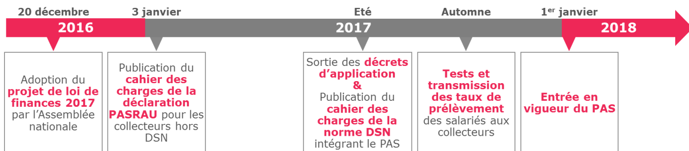
Schéma 2 : Calendrier de mise en œuvre du PAS à l'heure actuelle

L'état d'avancement du projet rendrait a priori difficile et coûteuse son abrogation par le prochain gouvernement.